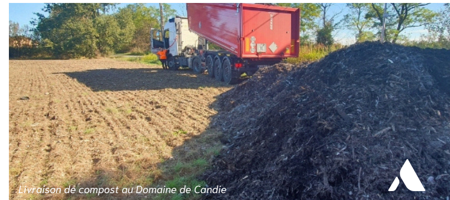
Livraison de compost au Domaine de Candie

Le Domaine de Candie, propriété de la Mairie de Toulouse depuis 1975, étendue sur 250 hectares de terres cultivées, utilise le compost Les Alchimistes. En 2024, 62 tonnes du compost des Alchimistes Occiterra ont été livrées (un total de 150 tonnes a été commandé et sera livré au fil des mois) pour des cultures variées : vignes, blé tendre, orge brassicole, pois chiches, lentilles, tournesol, etc. Ces cultures sont peu à peu redirigées vers des débouchés locaux, en travaillant notamment avec la cuisine centrale de Toulouse qui fournit les écoles de la ville, et dont les déchets alimentaires sont aussi collectés localement par les Alchimistes Toulousains. La boucle est bouclée !