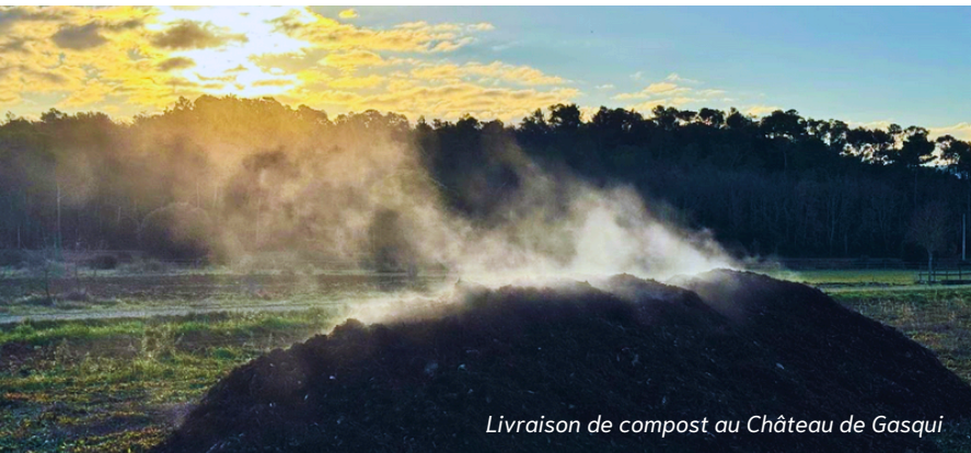
Livraison de compost au Château de Gasqui

Château de Gasqui, Domaine Bunan, viticulteurs du Castellet et de Cuers, Oé, ... En 2024, de nombreux viticulteurs passent au compost pour nourrir les vignes du sud ! Une grande étude est d'ailleurs coordonnée localement par Les Alchimistes Côte d'Azur, ImpactMaker et la chambre d'agriculture du Var pour suivre l'intérêt du compost en viticulture. L'étude inclut l'observation, la mesure et la modélisation pendant 2 ans des effets du compost sur les sols et sur la vigne.