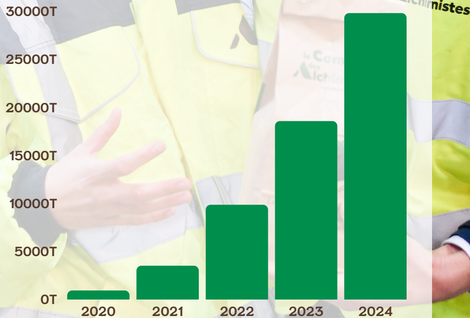
Tonnages de déchets collectés par le réseau Alchimistes depuis 2020.